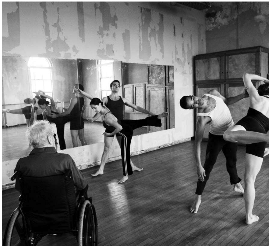
MERCE CUNNINGHAM DANCE COMPANY.

COREOGRAFIA PER 13 DANZATORI E 2 MUSICISTI DURATA: 80 MINUTI CIRCA, SENZA INTERVALLO